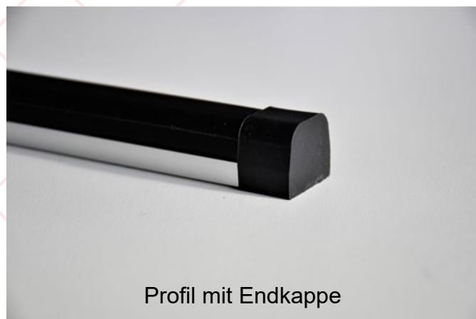
Profil mit Endkappe

Die TS8 ist eine flache Schaltleiste. Durch ihren kurzen Betätigungsweg eignet sie sich besonders zur Quetschkantenabsicherung mit geringem Nachlaufweg. Sie wird mit der zugehörigen flachen Aluminiumschiene montiert. Jeder Schaltleiste liegen Endkappen zum Aufstecken bei. Diese Endkappen umschließen sowohl das Profil als auch die Schiene.