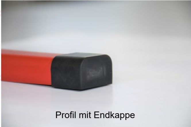
Profil mit Endkappe