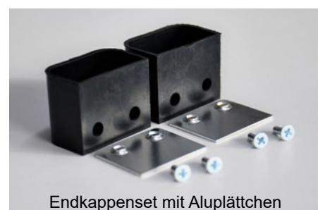
Endkappenset mit Aluplättchen

Weitere Informationen unter: www.tapeswitch.de